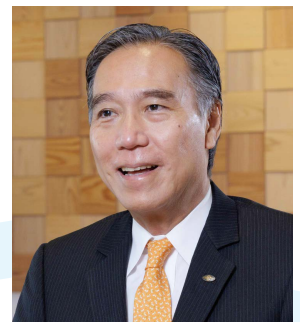
阿部 守一 あべ しゅいち